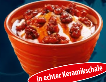
Copa Nata Nueces